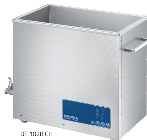
DT 1028 CH

Cuves à ultrasons de haute puissance pour le nettoyage ou le traitement des échantillons dans solutions aqueuses